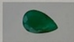
Imagen aproximada / Image is approximate