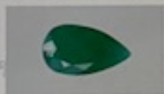
Imagen aproximada / Image is approximate