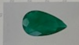
Imagen aproximada / Image is approximate

Cavidades Rellenas con Resina Endurecida Menor (C1) / Minor Amount of Hardened Resin in Cavities (C1)